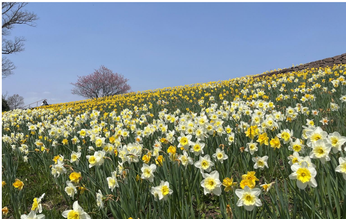
みのりの里「スイセン」「ハナモモ」の様子(2025年4月8日撮影)