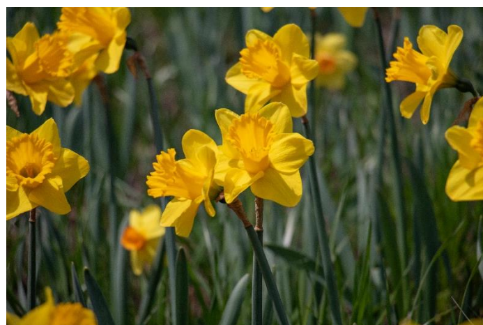
「スイセン(バレンウイン)」の現在の開花状況(2025年4月8日撮影)