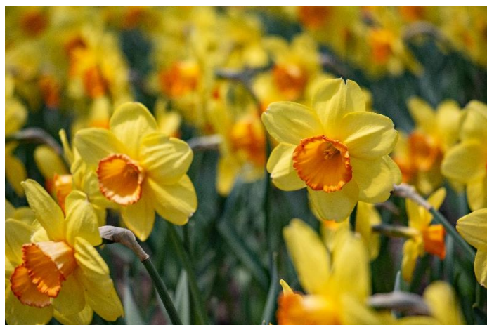
「スイセン(モナル)」の現在の開花状況(2025年4月8日撮影)