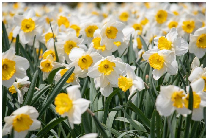
「スイセン(アーリーブライド)」の現在の開花状況(2025年4月8日撮影)