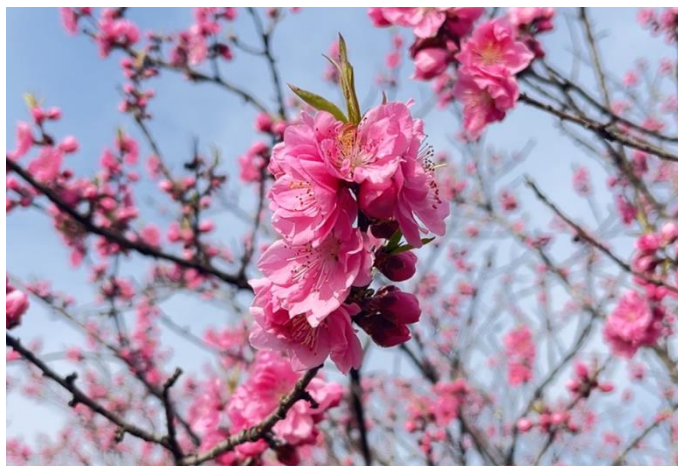
「ハナモモ」の現在の開花状況(2025年4月8日撮影)