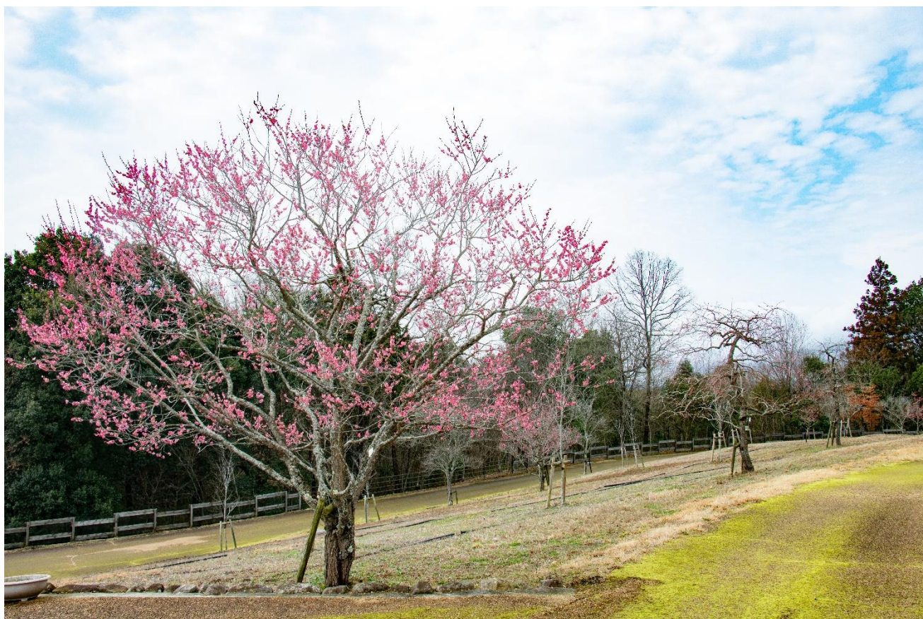
みのりの里「ウメ(未開紅)」の現在の開花状況(2024年2月20日撮影)