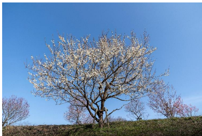
見頃となった時の みのりの里「ウメ」の様子(2023年以前撮影)