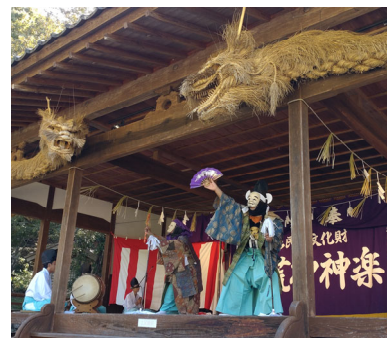
ひばの里 神楽上演