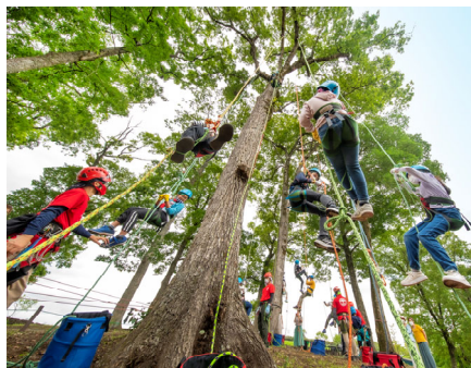
大芝生広場 ツリークライミング