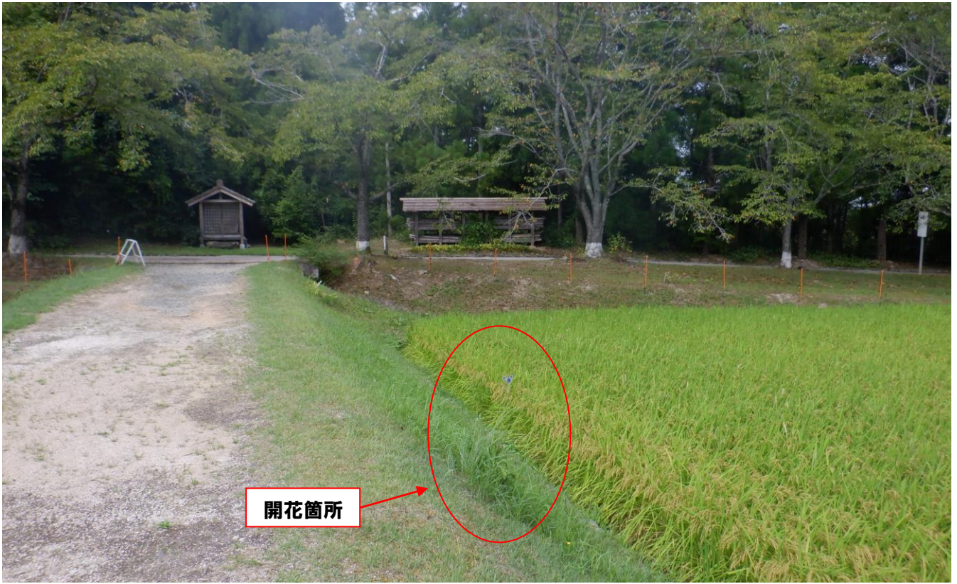
ひばの里の「ヒゴタイ」(2023年8月18日撮影・咲き始め)