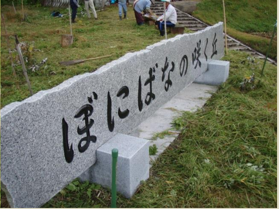
ぼにばなの咲く丘