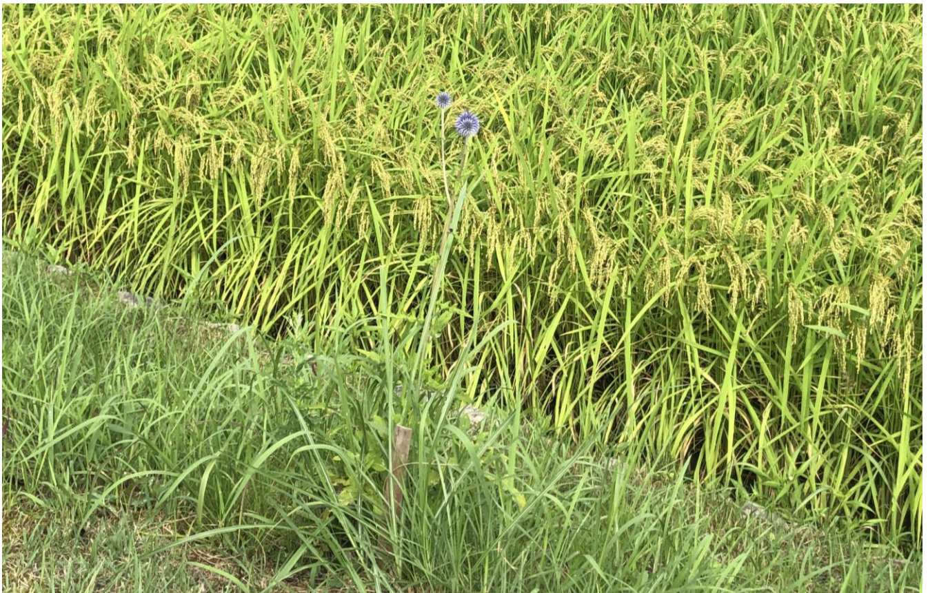
ひばの里の「ヒゴタイ」(2023年8月18日撮影・咲き始め)