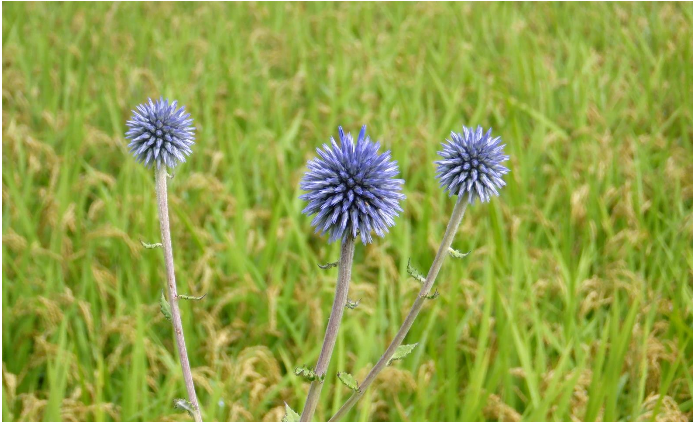
ひばの里の「ヒゴタイ」(2023年8月18日撮影・咲き始め)

当公園では、中国地方の貴重な生物種を有する里山の多様な自然環境の保全・活用に取り組んでいます。「盆花(ぼにばな) ヒゴタイ」は、庄原市比和町三河内地区の「ヒゴタイの会」の保全活動の取り組みを尊重し、かつその活動を伝えていくため、平成24年10月に種の保存を目的とし“ヒゴタイ種子の分譲依頼”を行い、県立広島大学と共同研究により育成した苗を平成25年7月に当公園の「ひばの里」に定植したものです。