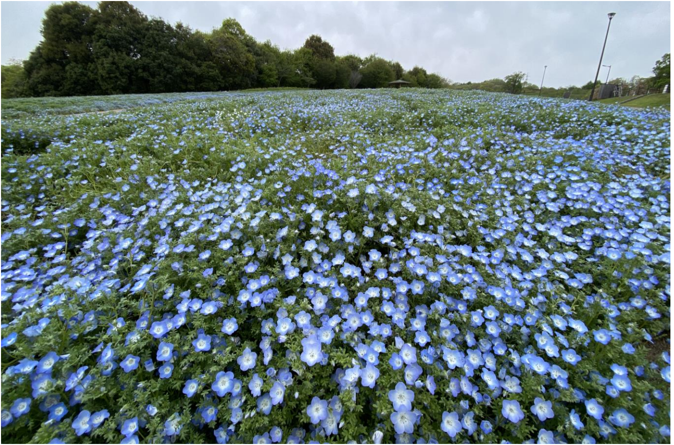
みのりの里 ピクニック広場「ネモフィラ」の様子（2023年4月24日撮影）