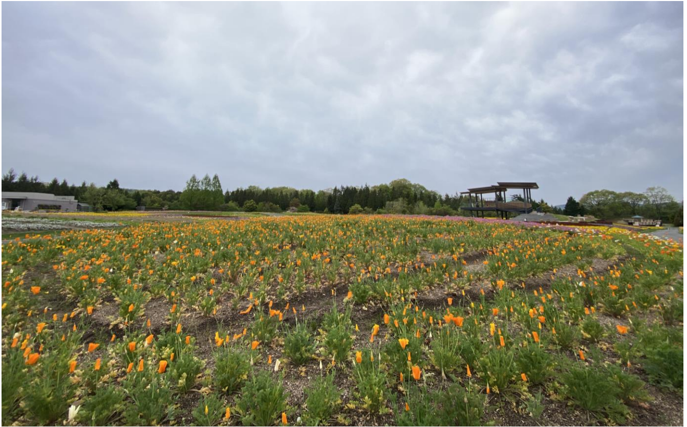
花の広場「ハナビシソウ」の様子（2023年4月24日撮影）