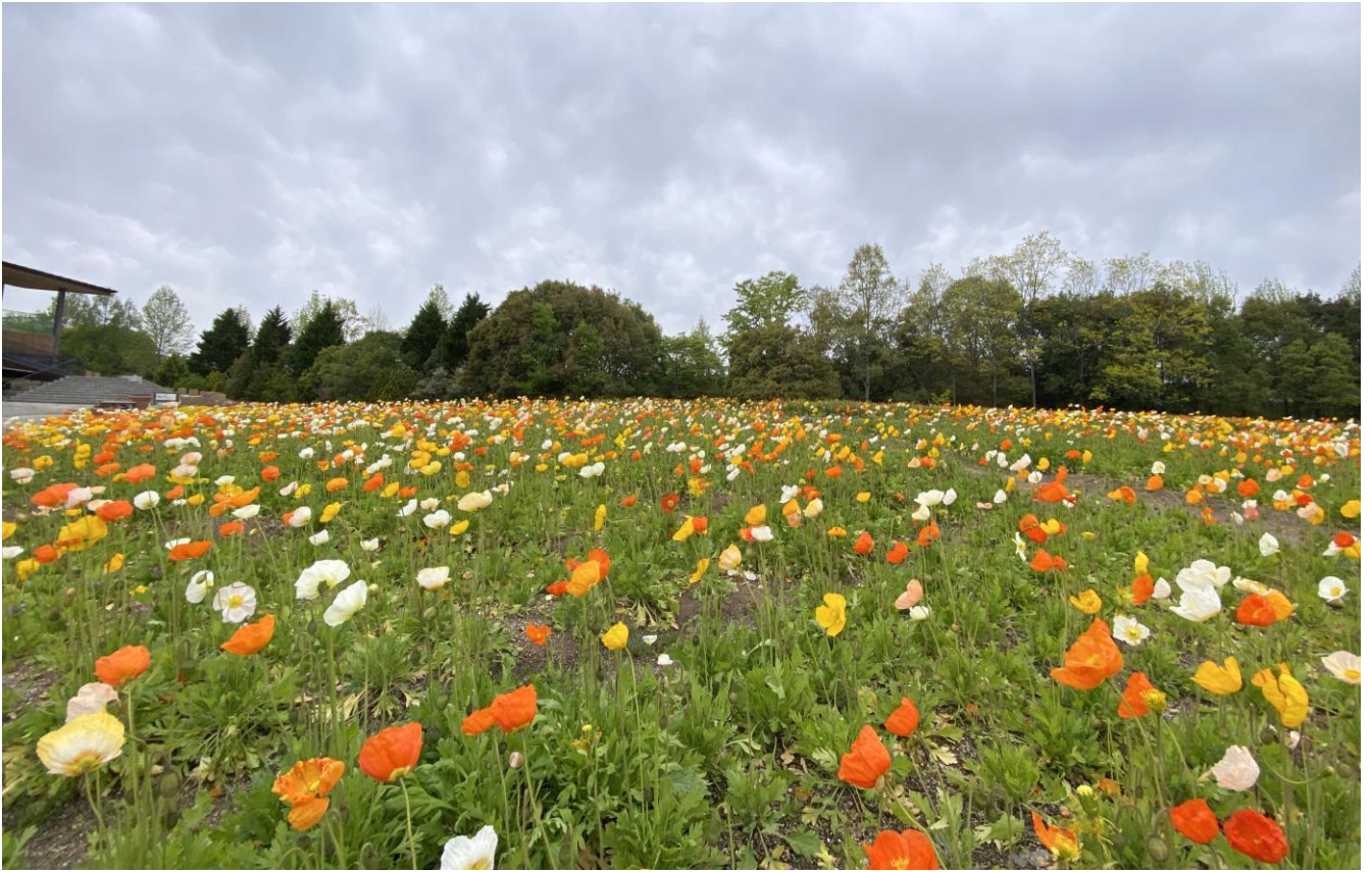
花の広場「アイスランドポピー」の様子（2023年4月24日撮影）