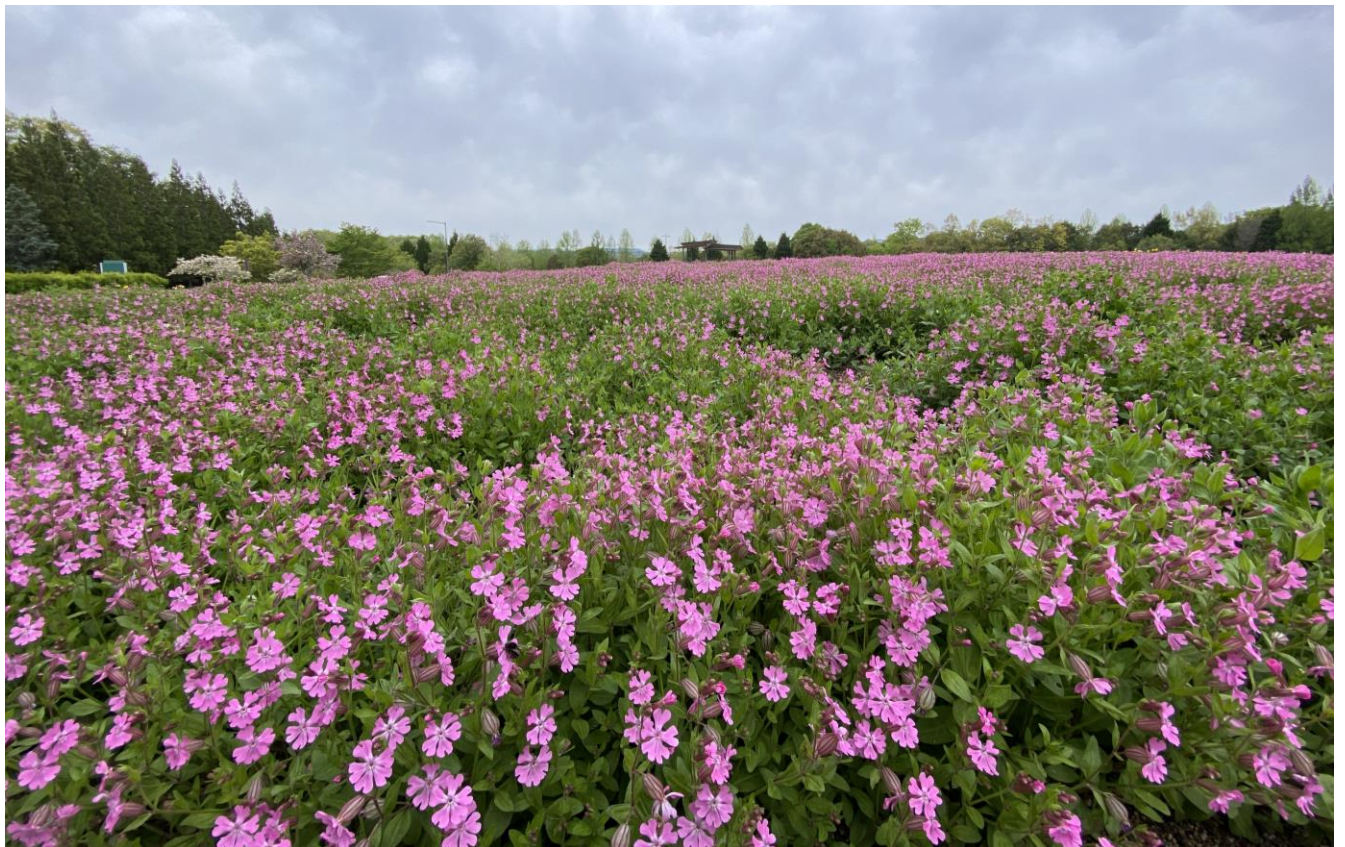
花の広場「桜ナデシコ」の様子（2023年4月24日撮影）