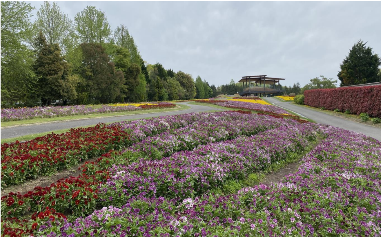
花の広場「ピオラ」の様子（2023年4月24日撮影）