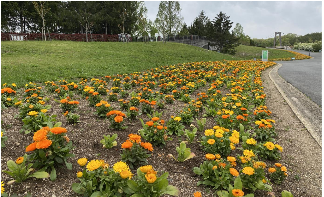
大芝生広場 北斜面「カレンデュラ」の様子（2023年4月24日撮影）