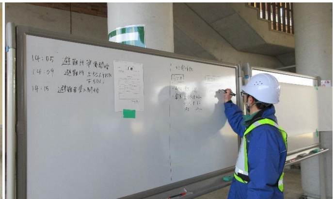
過年度の「一時避難所開設訓練」の様子(2019年3月14日撮影)

当公園は庄原市の緊急避難場所に指定されており、地震等の災害発生時に来園者及び周辺住民の方を受け入れる環境を引き続き維持・向上することで、地域の防災性向上に寄与することを目指しています。