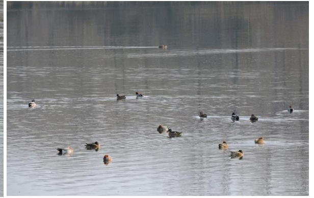
国兼池「水鳥観察会」(2021年1月撮影)

マガモをはじめとする水鳥が国兼池へ飛来する時期にあわせて、多くの水鳥や野鳥を来園者の皆さまにお楽しみいただけるよう「水鳥観察会」を開催します。