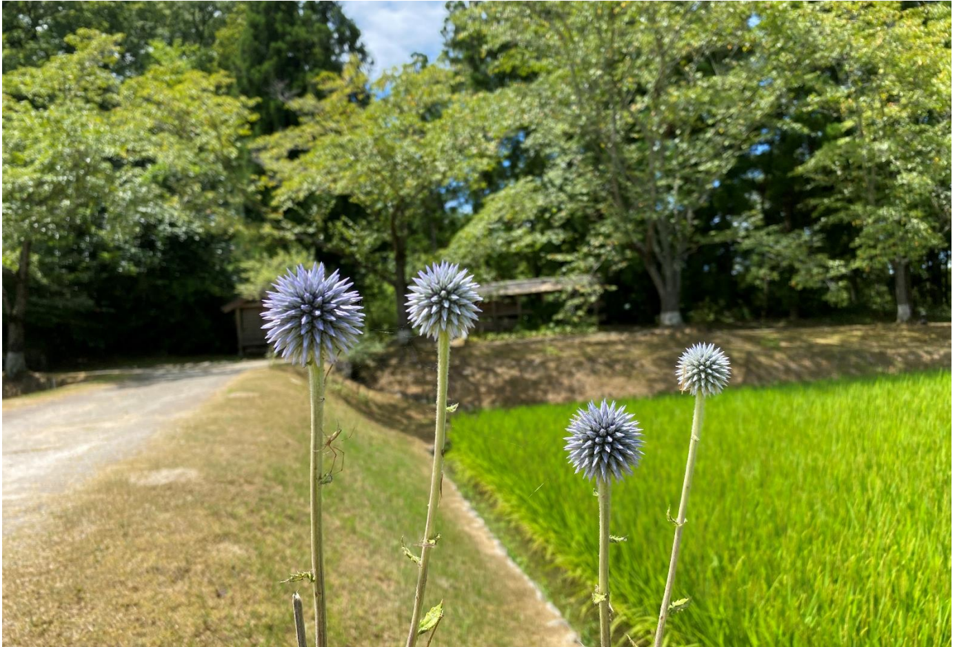
ひばの里「盆花(ぼにばな) ヒゴタイ」の様子(2021年8月6日撮影)

当公園では、中国地方の貴重な生物種を有する里山の多様な自然環境の保全・活用に取り組んでおり、庄原市比和町〔ヒゴタイの会〕の保全活動の取り組みを尊重し、その活動を連携して伝え、ヒゴタイを通して文化への理解、自然環境や植物の保全を啓発することにより備北地域の活性化に寄与することと考えています。