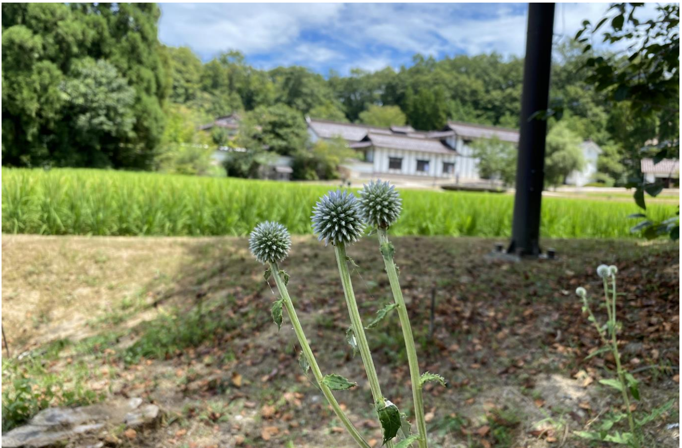
ひばの里「盆花(ぼにばな) ヒゴタイ」の様子 (2021年8月6日撮影)