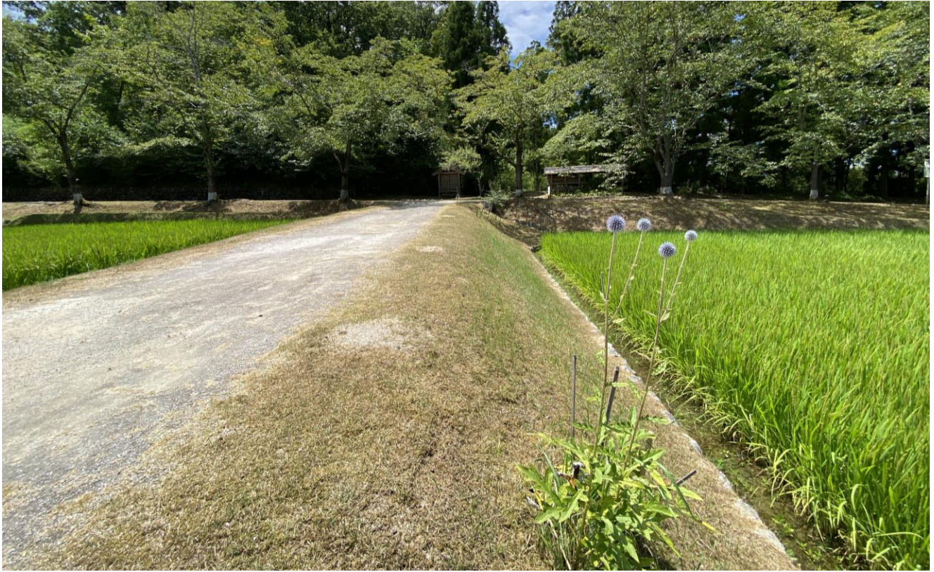
ひばの里「盆花(ぼにばな) ヒゴタイ」の様子 (2021年8月6日撮影)