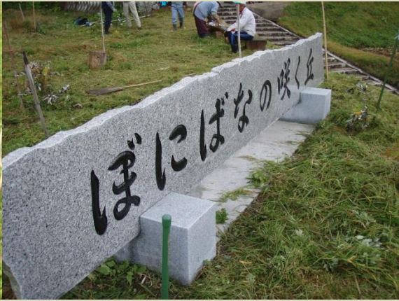
ぼにばなの咲く丘