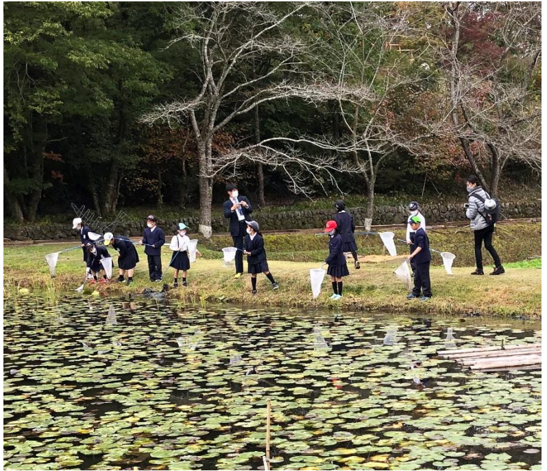
ひばの里「自然観察会」(2020年6月・9月・10月撮影)

当公園では、庄原市内小学校の課外授業の一環として、庄原市立東小学校の児童の皆さんを対象に「自然観察会」を以下表のとおり年4回開催しています。公園内の動植物を採集・観察し、子どもたちに自然の大切さについて学んでもらうプログラムです。