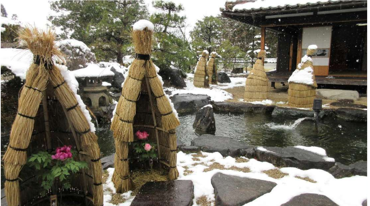
ひばの里 さとやま屋敷「冬咲きぼたん展」(2020年2月18日撮影)

今年で17回目となる「冬咲きぼたん展」を、2021年1月23日(土)より開催します。冬に咲くように開花時期を調整したぼたんの花を「ひばの里 さとやま屋敷」に展示し、公園利用者の皆様へ花と屋敷の風情のある景色を楽しんでもらいます。