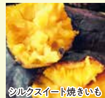
シルクスイート焼きいも

絹のような繊細な食感と、蜜たっぷりであっさりとした甘さが特徴のシルクスイートを焼きいもに。温かいうちにどうぞ。