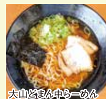
大山どまん中らーめん

“大山どまん中らーめん”の麺は、大山町の小麦「ミナミノカオリ」を100%使用。小麦本来の味がする、こしの強い麺です。