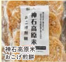
神石高原米 おこげ煎餅

清らかな水と、澄みきった空気の中で農薬を使わず丹精込めて育てられた神石高原米を使用した特別な“おこげ煎餅”です。