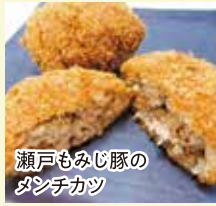
瀬戸もみじ豚のダシチカツ

ブランド豚「瀬戸もみじ豚」と庄原産タマネギを使ったメンチカツ。サクッとジューシーでピーターも多い人気商品です。