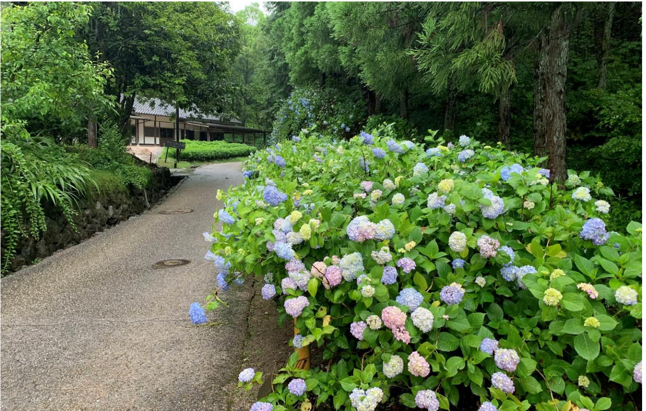
ひばの里 アジサイ園「アジサイ」の様子（2020年6月18日撮影）