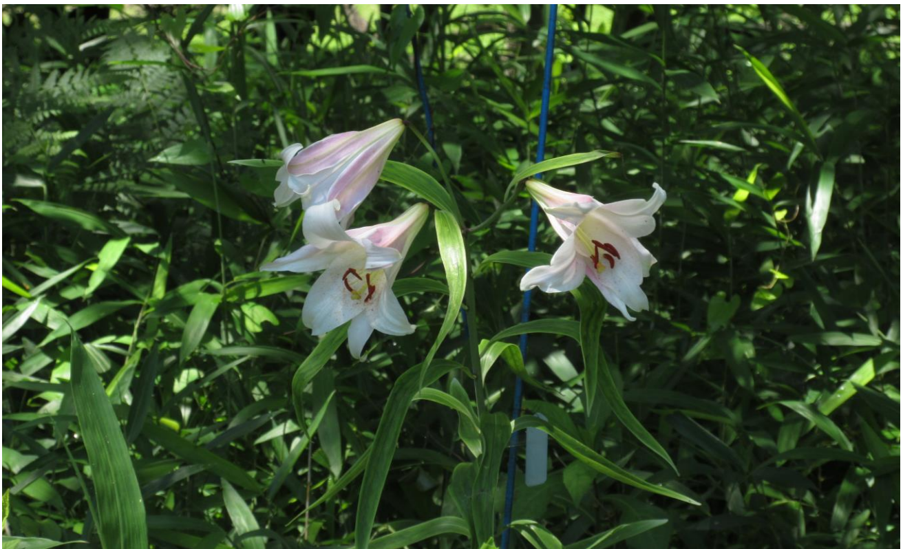
みのりの里 ササユリ保全地「ササユリ」の様子（2020年6月18日撮影）