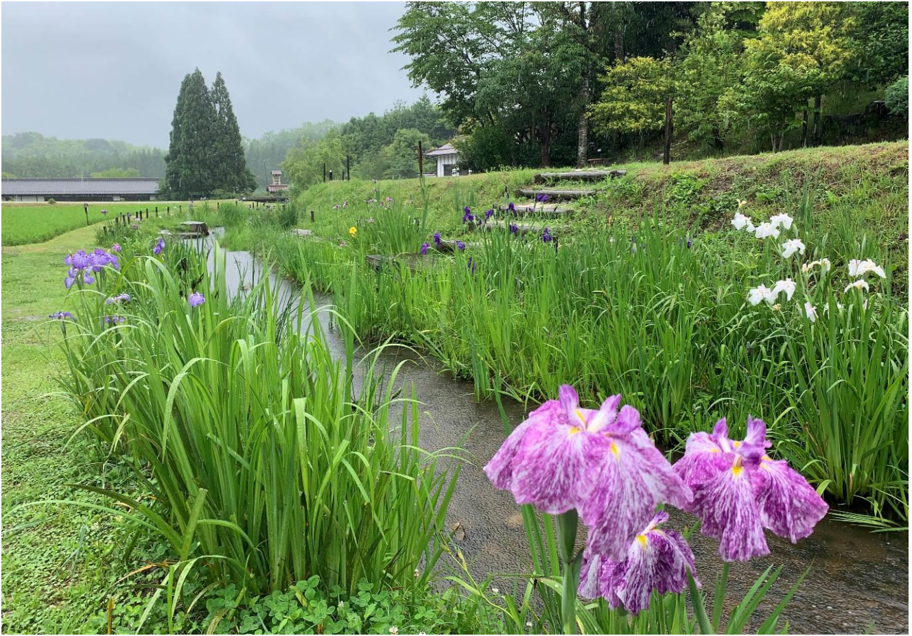
ひばの里 小川沿い「ハナショウブ」の様子（2020年6月18日撮影）