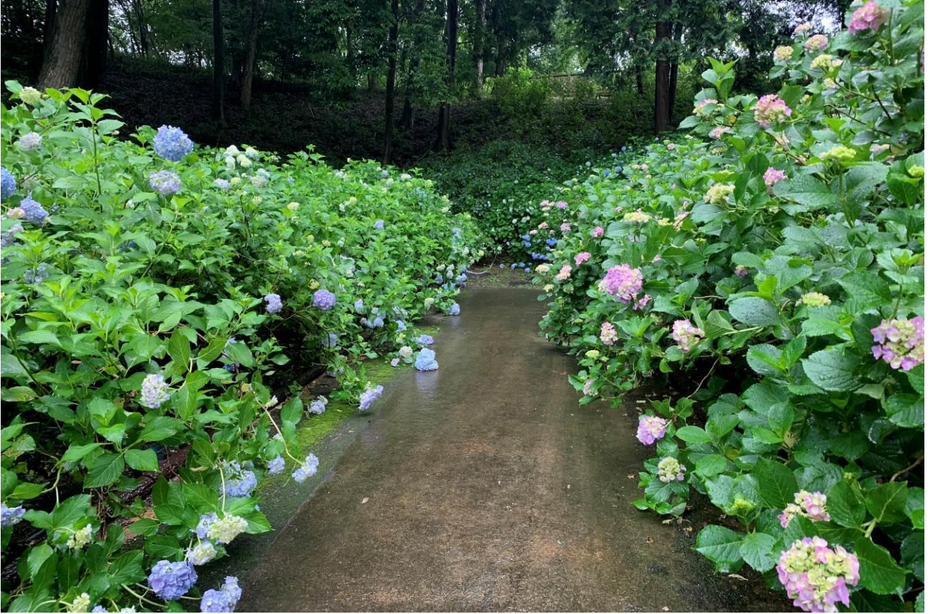
ひばの里 アジサイ園「アジサイ」の様子（2020年6月18日撮影）