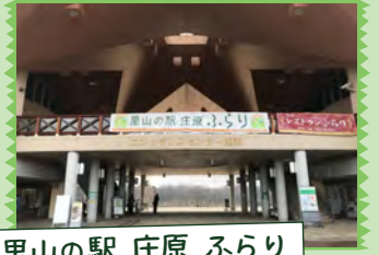
里山の駅 庄原 ぶらり

日本最大級規模！ 195万本・700品種を誇る スイセンガーデンと、 みのりの里エリアに咲く 春の花々をお楽しみいただく コースです。