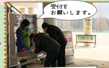
エントランスセンター