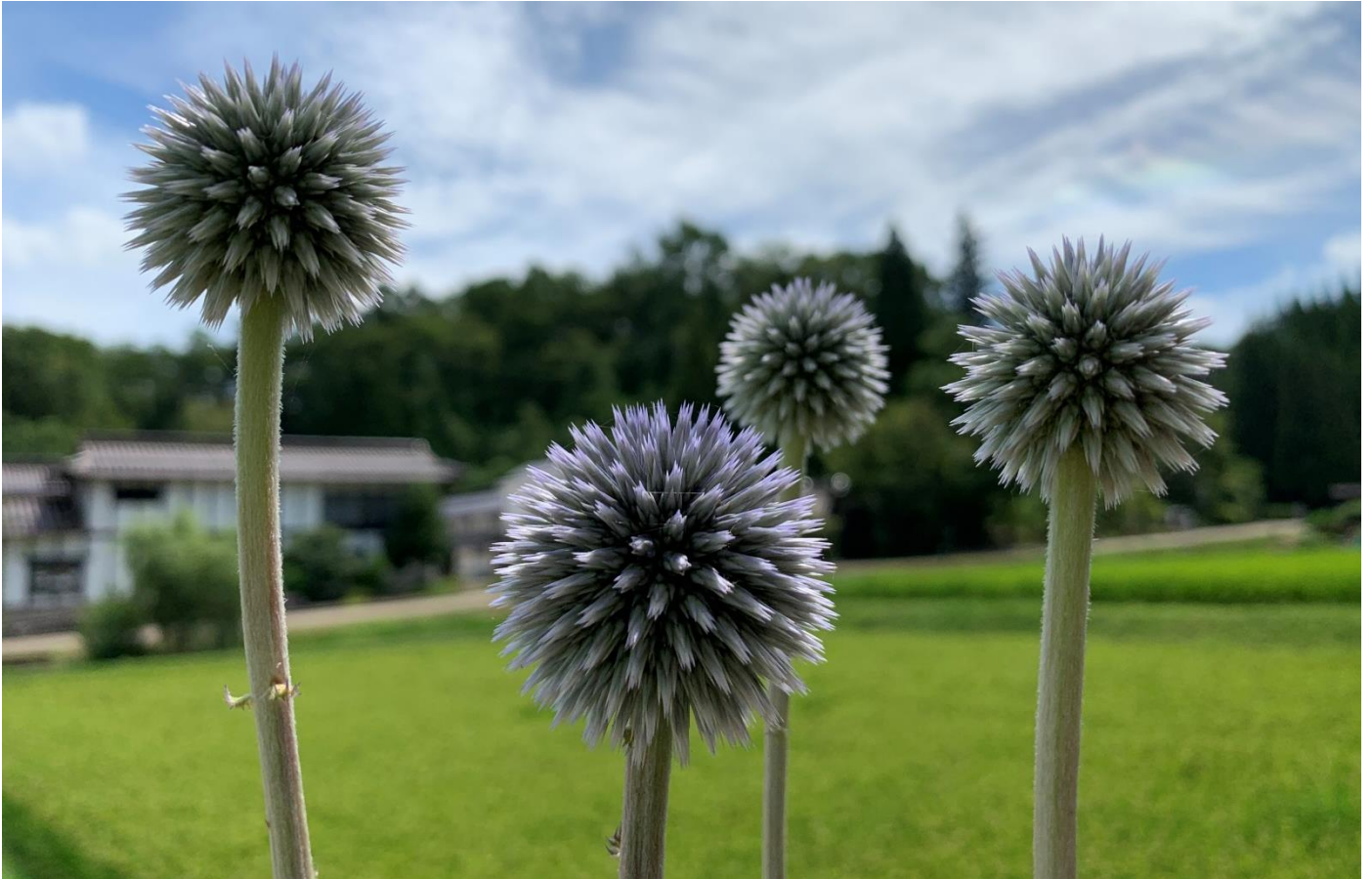
ひばの里「盆花(ほにはな) ヒゴタイ」の様子(2019年8月9日撮影)