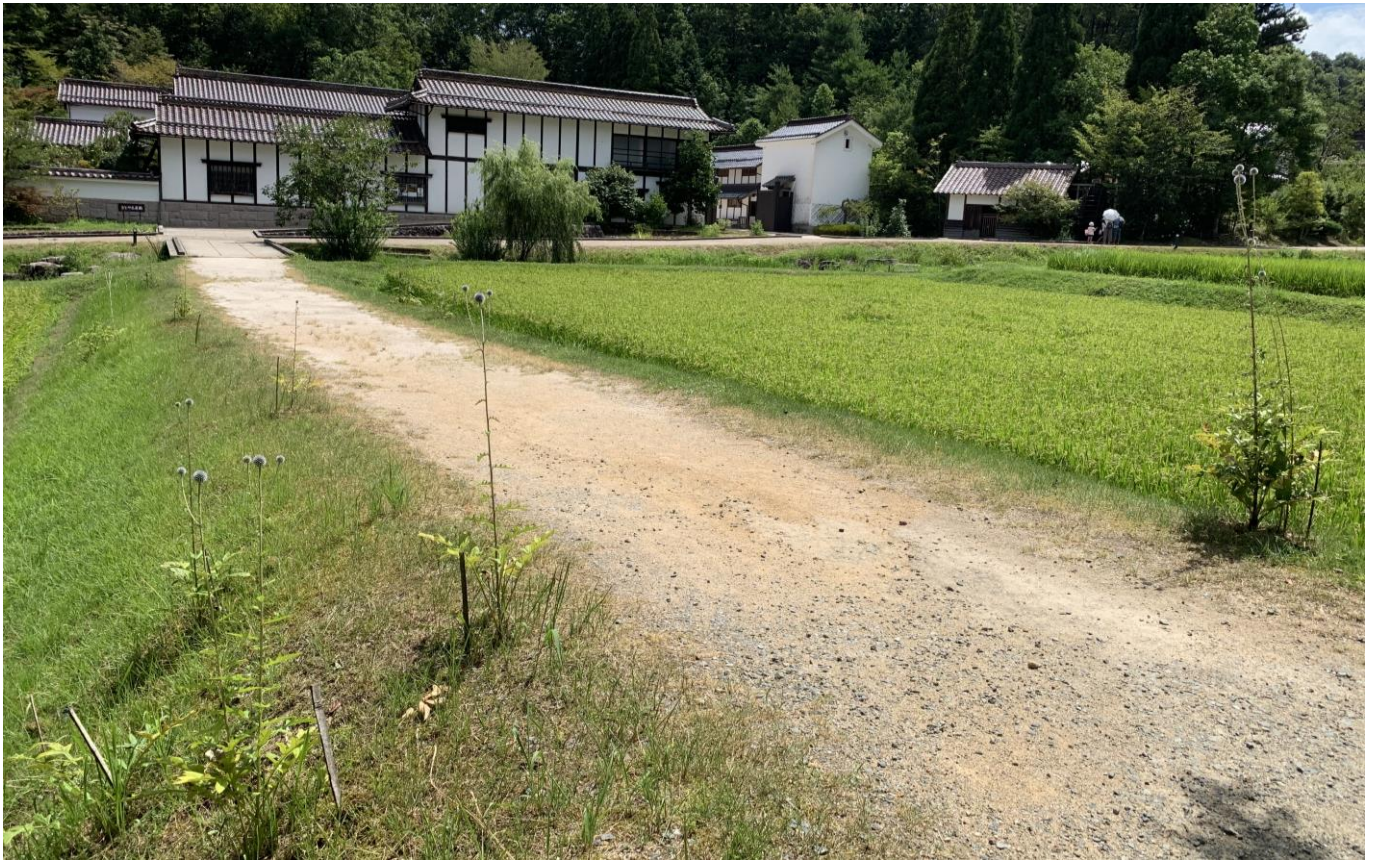
ひばの里「盆花(ぼにばな) ヒゴタイ」の様子(2019年8月9日撮影)