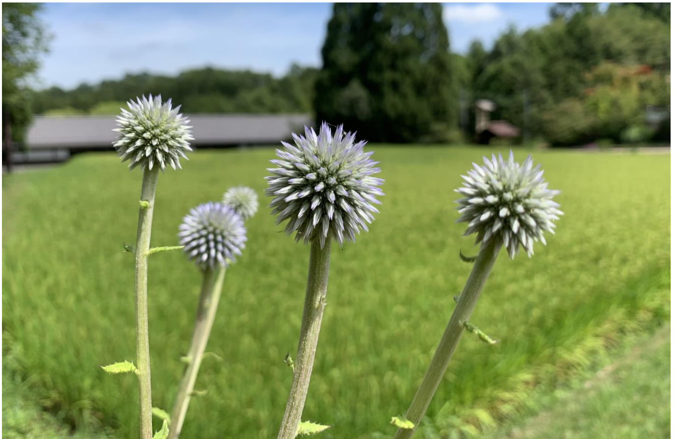
ひばの里「盆花(ぼにばな) ヒゴタイ」の様子(2019年8月9日撮影)