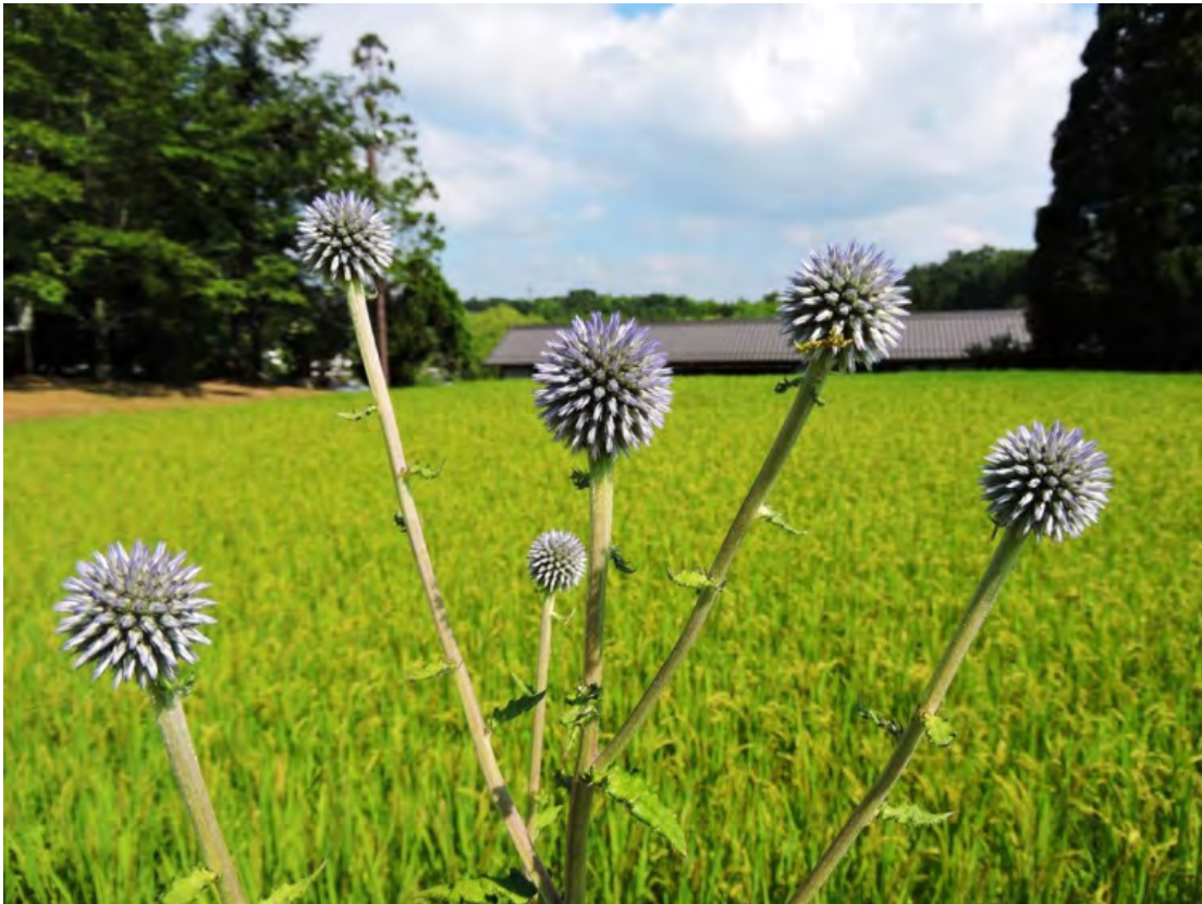
ひばの里「盆花(ぼにばな) ヒゴタイ」の様子(2018年8月6日撮影)