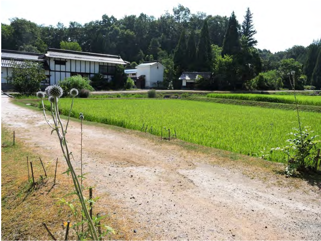
ひばの里「盆花(ぼにはな) ヒゴタイ」の様子(2018年8月6日撮影)