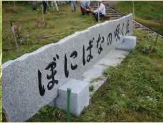
ぼにばなの咲く丘