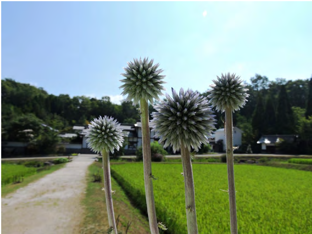
ひばの里「盆花(ぼにはな) ヒゴタイ」の様子(2018年8月6日撮影)