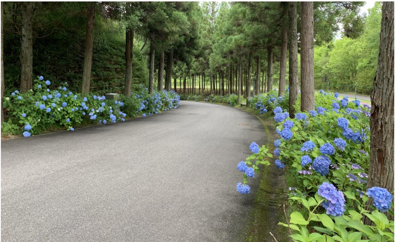
杉並木「アジサイ」の様子（2019年6月28日撮影）