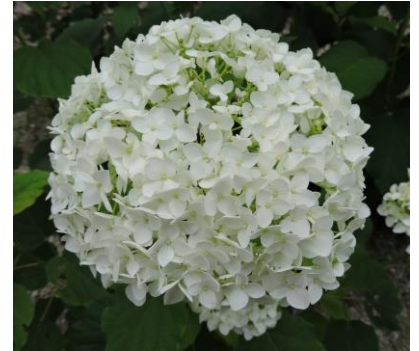
アナベル (約 200 株)