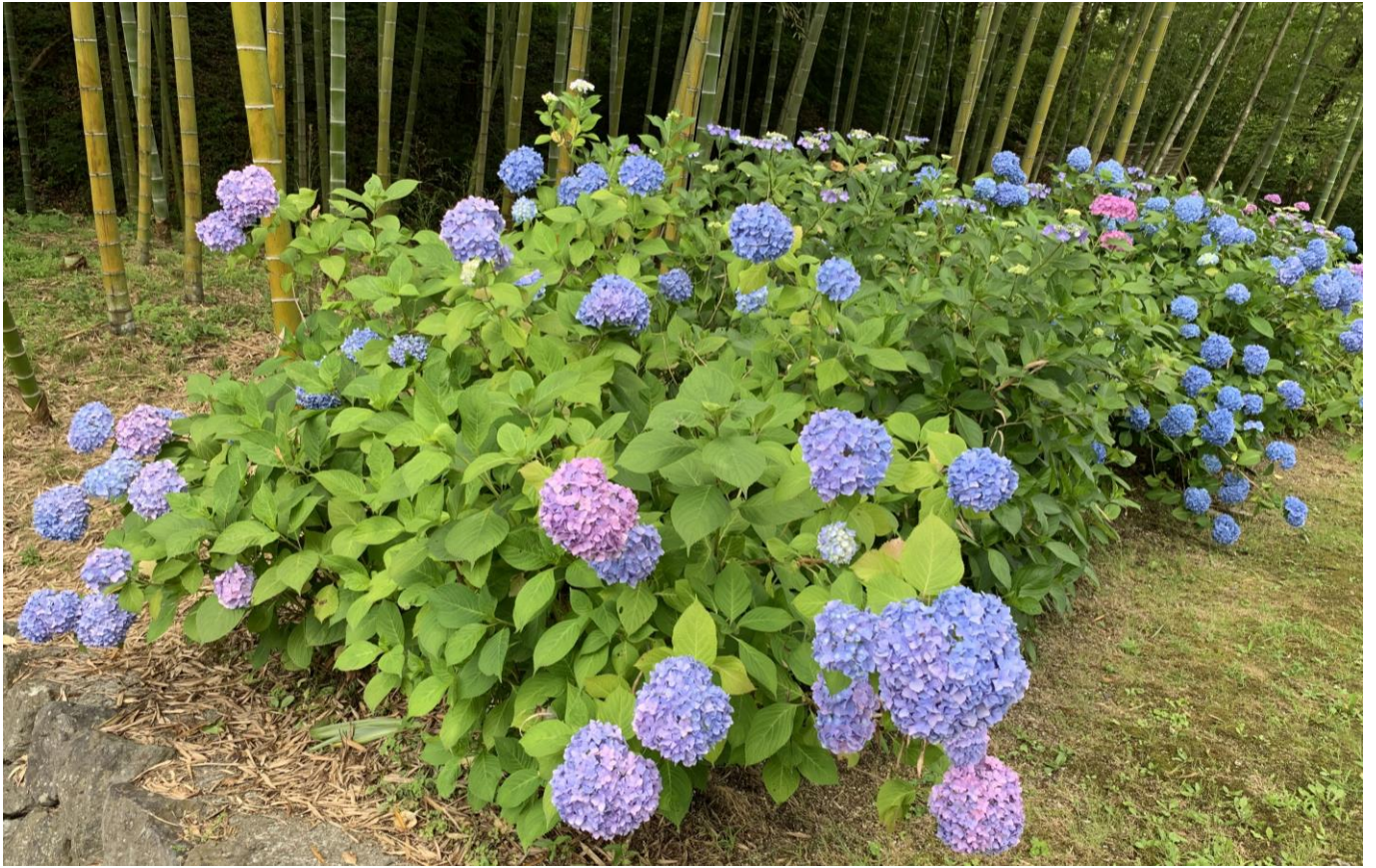
ひばの里 竹林「アジサイ」の様子（2019年6月28日撮影）