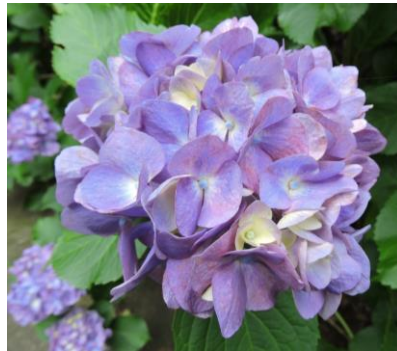
センセーション (約 100 株)