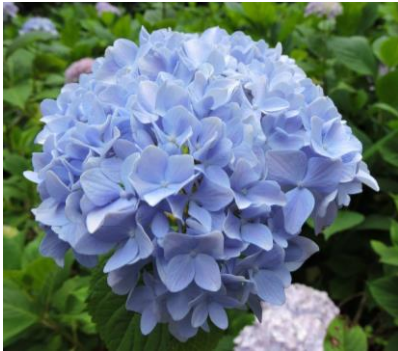
ホンアジサイ (約 1,000 株)