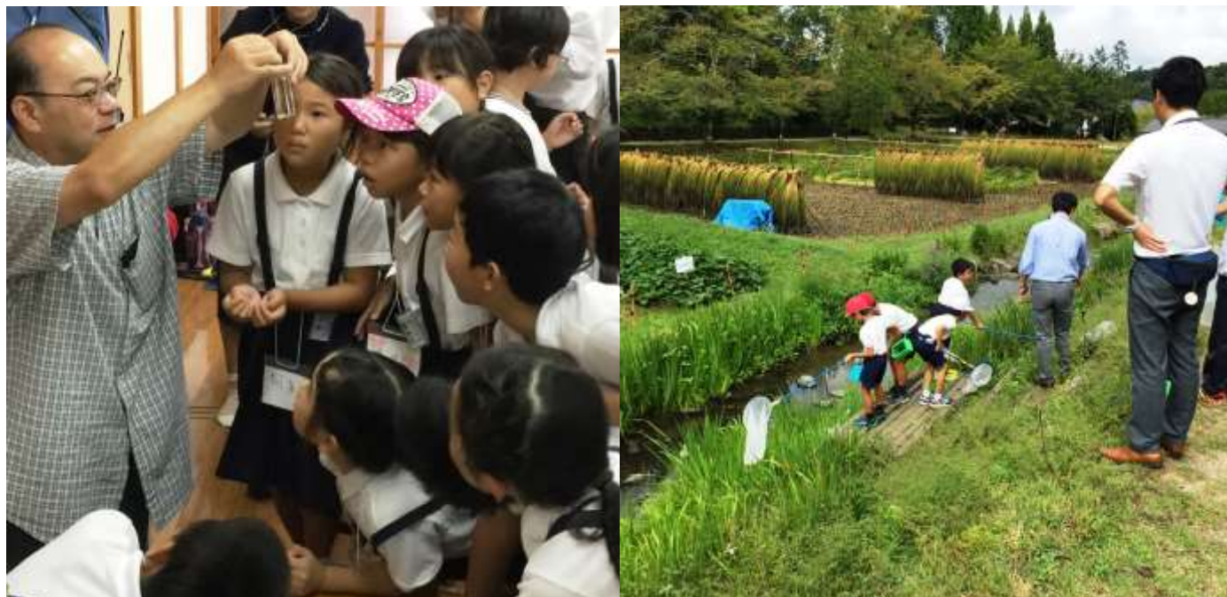
昨年の「第2回 自然観察会」の様子（2017年9月12日撮影）

当公園では、庄原市内小学校の課外授業の一環として「自然観察会」を年4回行います。公園内の動植物を採集・観察し、子どもたちに自然の大切さについて学んでもらうプログラムです。