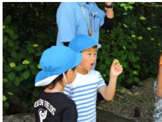
昨年の「梅もぎ・梅ジュースづくり」の様子(2017年6月16日撮影)