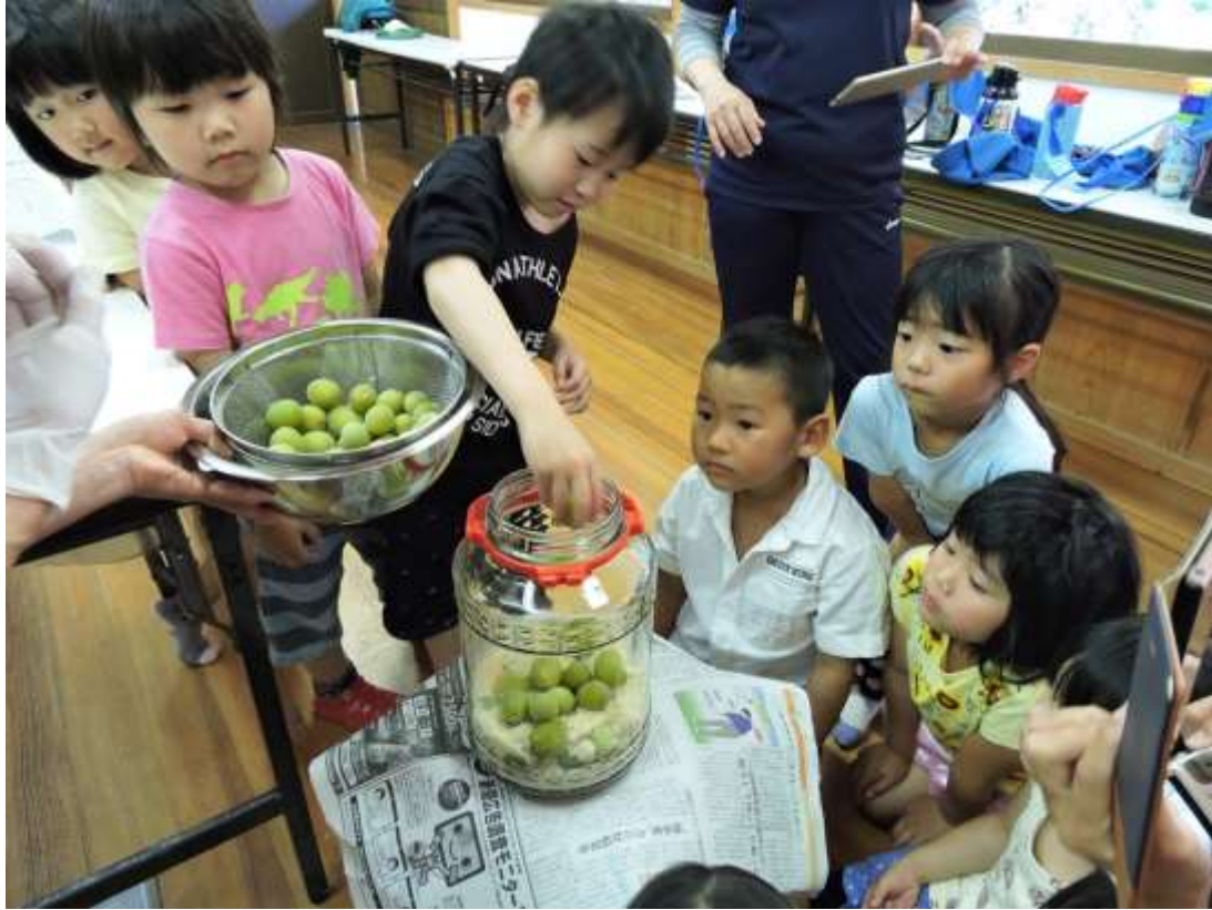
昨年の「梅もぎ・梅ジュースづくり」の様子(2017年6月16日撮影)

6月15日(金)に庄原市内の“おじいちゃん・おばあちゃん”(協力：地域ボランティア)と庄原市内の保育園児(参加：敷信みのり保育所)と一緒に昔の暮らしを体験する世代間交流プログラム「梅もぎ・梅ジュースづくり」を開催します。昔懐かしい梅もぎ・梅ジュースづくりを通して、子ども達にさとやまの食文化を学んでいただくと共に地域の大人と子どもの交流をしていただくプログラムです。