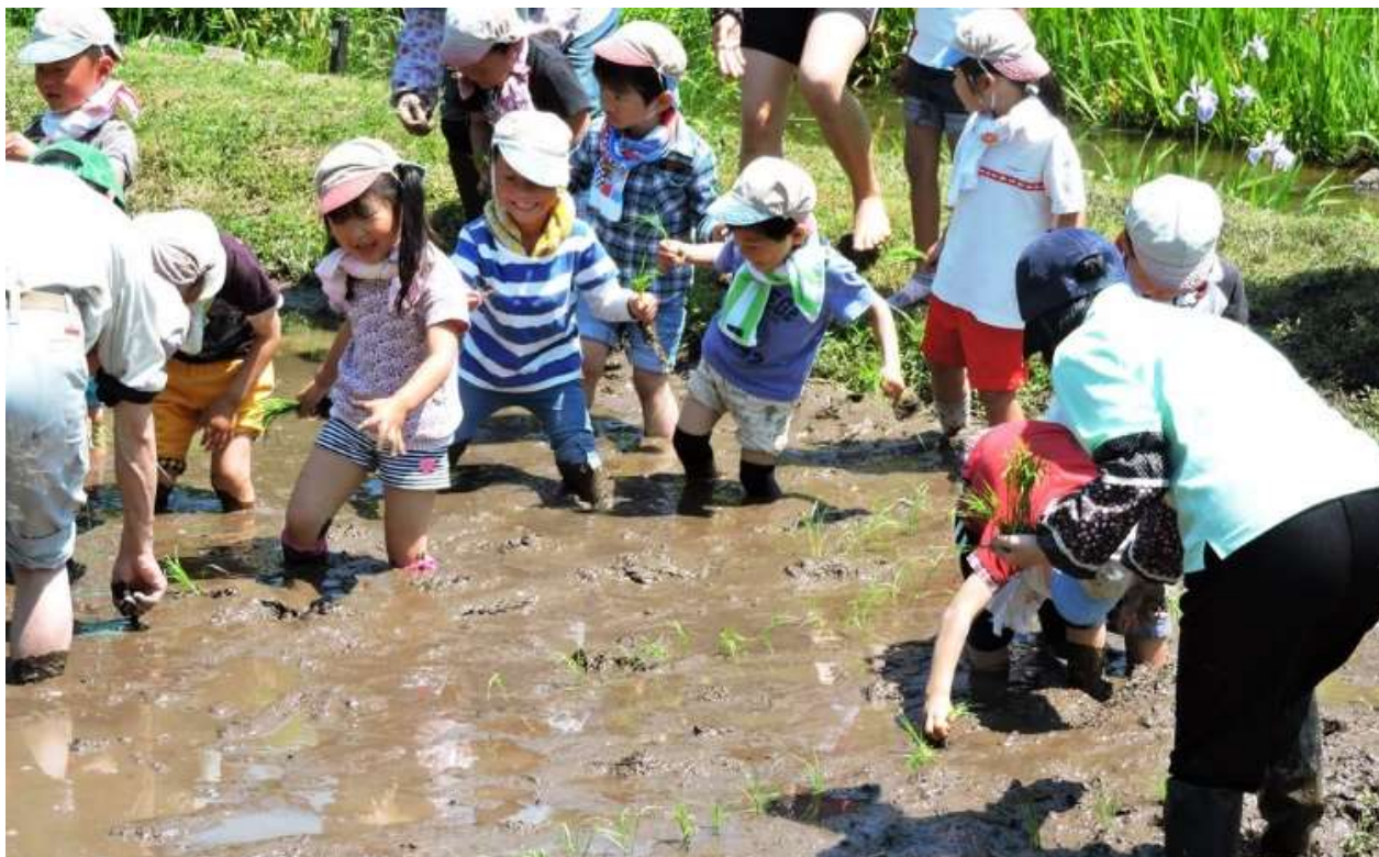
昨年度の「田植え体験」の様子(2017年5月19日撮影)

庄原市内の“おじいちゃん・おばあちゃん”（協力：地域ボランティア）と一緒に庄原市内の保育園児（参加：庄原保育所）が「お米づくり」を体験する世代間交流プログラムを開催します。5月18日（金）は「田植え体験」を行い、昔ながらの「田植え」を通して、子ども達にさとやまの食文化を学んでいただくと共に、地域の大人と子どもの交流を行っていただくプログラムです。