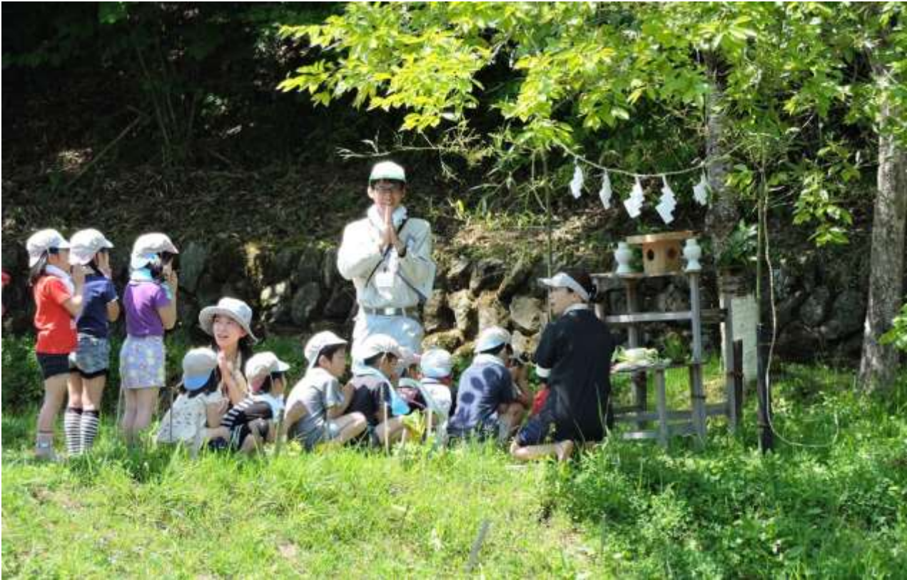
ひばの里 田んぼ「田植え体験」の様子（2017年5月19日撮影）