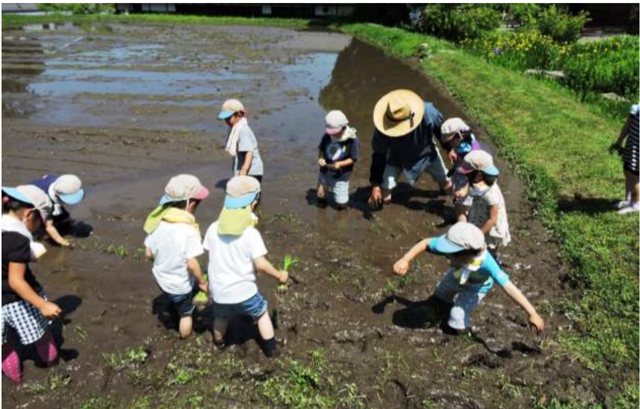
ひばの里 田んぼ「田植え体験」の様子（2017年5月19日撮影）