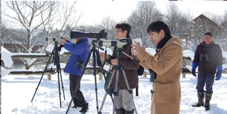
昨年度の「水鳥観察会」の様子(H29年2月12日撮影)

今年もオシドリやマガモなどの水鳥が国兼池へ飛来する季節になりました。この時期に飛来してくる多くの水鳥を来園者の皆さまへお楽しみいただけるよう「水鳥観察会」を開催します。